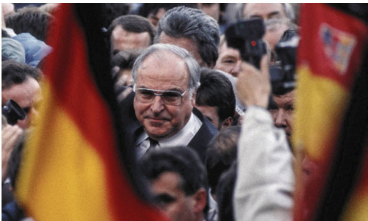
Dr. Helmut Kohl: Kanzler der Einheit und Ehrenbürger Berlins

Ort jedoch offengelassen. Nun wird diese Initiative von Berlins Regierendem Bürgermeister Kai Wegner (CDU) aufgenommen. Er kündigte Gespräche mit dem Bezirk Mitte an, um einen angemessenen Standort zu finden. Suche im Regierungsbezirk Mitte „Sicherlich ist der Bezirk Mitte mit Bundestag und Bundeskanzleramt prädestiniert, hier an den Kanzler der Einheit zu erinnern“, so Wegner. „Ich werde dazu Gespräche mit dem Bezirk führen, denn wir wollen Helmut Kohl im Berliner Stadtbild würdigen.“