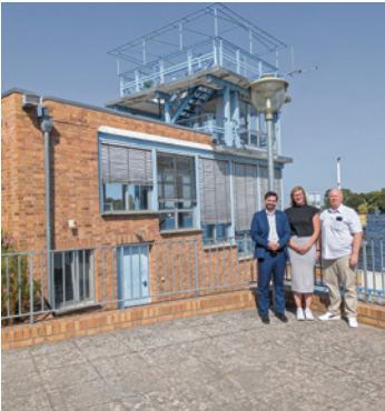
Aktueller Zustand des Zielturms Grünau