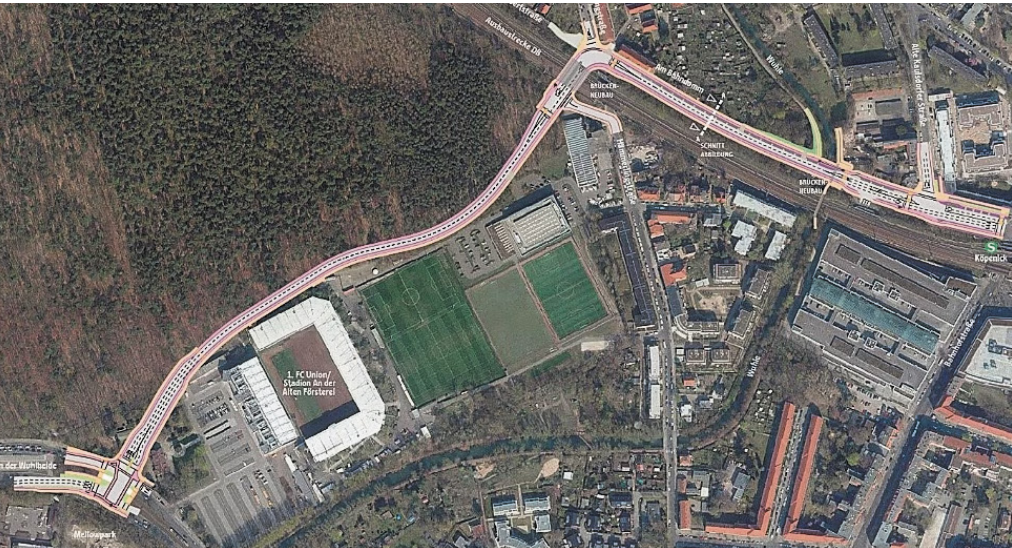
Aktueller Planungsstand Westumfahrung (Apricot = Fußweg, Violett = Sicherheitsstreifen/Trennung, Orange = Radweg, Grün = Baumscheibe/Begrünung, Grau = Fahrbahn)

Die Streckenführung umfasst eine Gesamtlänge von 1,2 Kilometern. Von der Straße An der Wuhlheide geht es hinter dem Stadion an der Alten Försterei in Richtung Hämmerlingstraße und der Straße Am Bahndamm. Die Westumfahrung wird dort auf die Kreuzung Mahlsdorfer Straße / Bahndamm und Stellingdamm münden. Da die Rudolph-Rühl-Allee im Rahmen der TVO renaturiert werden soll, ist die Westumfahrung nicht mit dieser Straße verbunden, sondern direkt mit der Straße An der Wuhlheide. Die Streckenplanung wurde so angelegt, dass möglichst wenig Fläche der Wuhlheide betroffen ist. Auch das Gelände des 1. FC Union soll so we-