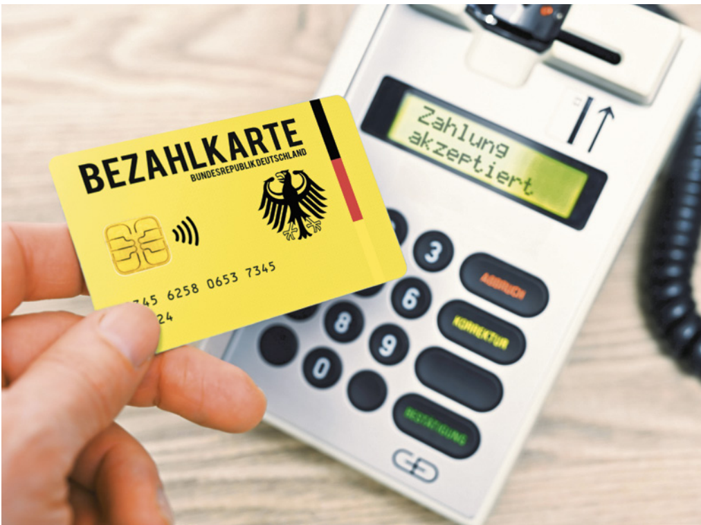
Bezahlkarte für Asylbewerber mit beschränktem Guthaben von 50 Euro

Die Hoffnung auf ein wirtschaftlich besseres Leben ist kein Asylgrund. Die Karte verhindert, dass Asylbewerber mit den Leistungen, die für ihren Lebensunterhalt gedacht sind, ihre Schleuser bezahlen oder Geld ins Heimatland schicken. Mit der Karte wird der Verwaltungsaufwand gesenkt. Anreize für die Migration nach Deutschland ohne Asylgrund werden gesenkt.