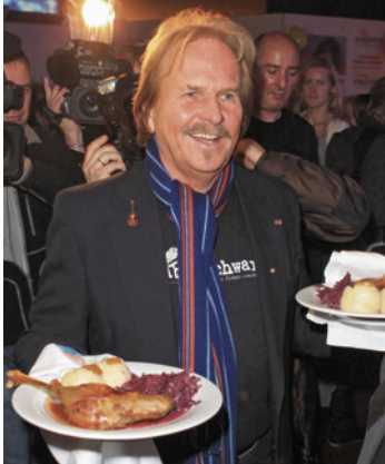
Frank Zander, Berliner Original

Zander und sein Sohn wurden für ihre sozialen Verdienste mit dem Bundesverdienstkreuz ausgezeichnet. Seine neu gegründete Stiftung unterstützt eine Caritas-Tagesstätte, die sich um Drogenabhängige kümmert.